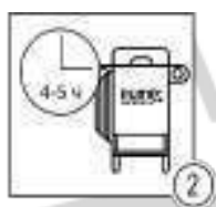
Шаг 2 - Очистка системы с элиминатором®