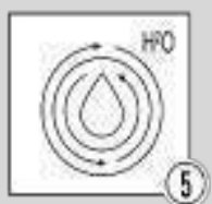
Шаг 5 - Промывка системы водой