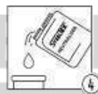
Шаг 4 - Нейтрализация кислотности теплообменника