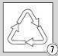
Шаг 7 - утилизация промывочного раствора

При применении рекомендуется использовать защитные очки Pipal® SteelTEX® EYE PROTECTION , перчатки Pipal® SteelTEX® HAND PROTECTION и респиратор Pipal® SteelTEX® RSP , защитную обувь Pipal® SteelTEX® SAP .