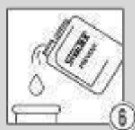
Шаг 6 - Пассивация