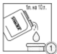
Шаг 1 - Приготовление промывочного раствора